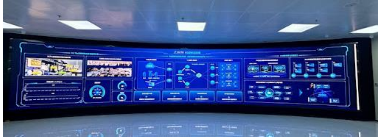
紫金山無人機試驗場