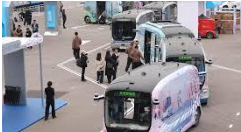
北京經開區自動駕駛試驗區